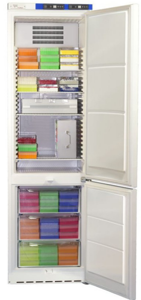
ProfiFrost PFU40xxKWU (Fig. with inventory system. See catalogue.)