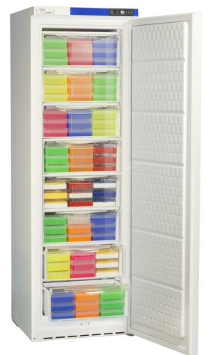
Photo on the right shows ProfiFrost PFU3530WN resp. ProfiFrost PFU3545WN without refrigerator see page B10.2